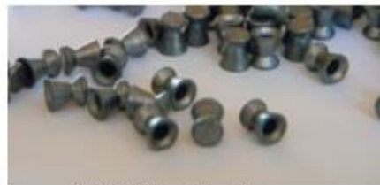
Foto 2: Diabolo kogeltjes